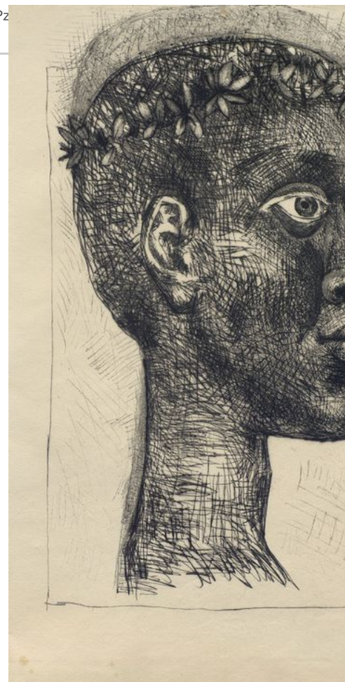
«Negre, negre, negre...». Retrato de Aimé Césaire laureado (Vallauris, 15.11.1949). Punta seca y raspador sobre cobre